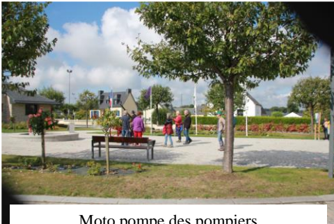
Moto pompe des pompiers

Le 10 septembre, 38 membres de notre club « La Joie de Vivre d'Andel » ont été accueillis par le club de l'Amitié de Trémoriel toute la journée. Le matin, après un accueil café au boulodrome des associations, le club de l'Amitié nous avait organisé une randonnée de 7 kms en empruntant la voie verte pour arriver aux lieux dit les Treize-Chênes qui nous a permis de découvrir la belle chapelle construite au XVIII e siècle et restaurée avec le concours de la commune et une association locale. Ensuite nous avons rejoint le bourg pour déambuler dans les rues aménagées et fleuries tout en découvrant sur divers panneaux implantés dans différents endroits des photos de certains quartiers au début du XX e siècle. Le midi lors d'un moment convivial, la Présidente,