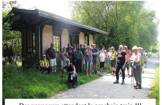
Des voyageurs attendent le prochain train !!!